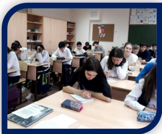
Социологический опрос учащихся 9-11 классов «Мое отношение к коррупции»