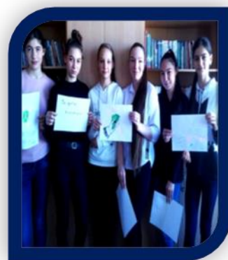
Участники круглого стола «Мы против Коррупции!» учащиеся 9В класса обсудили проблемы противодействия коррупции.