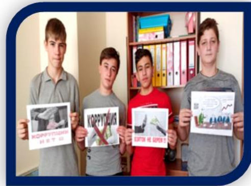
Участники конкурса рисунков «Скажем коррупции: нет!» в поддержку Акции «Чистые руки – чистая совесть» учащиеся 8 «Б» класса