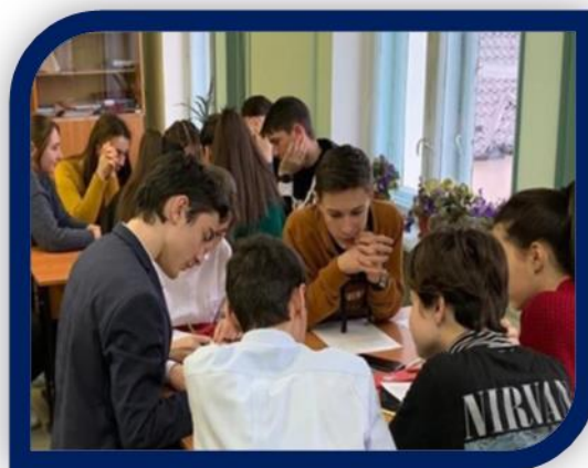
Интеллектуально-правовой конкурс «Молодежь и закон» в 9-11 классах